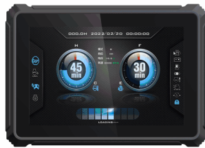
2 路 CAN bus 数据总线