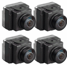
4 路AHD 720P摄像头